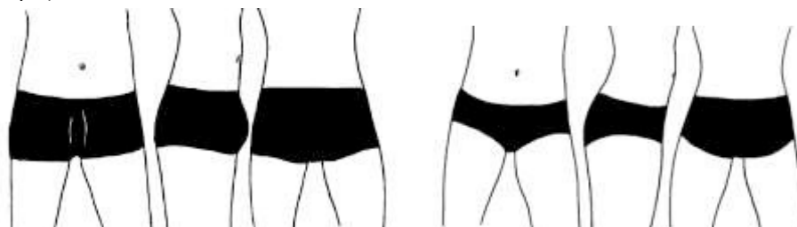
Minimalne zakrycie - Męskie szorty